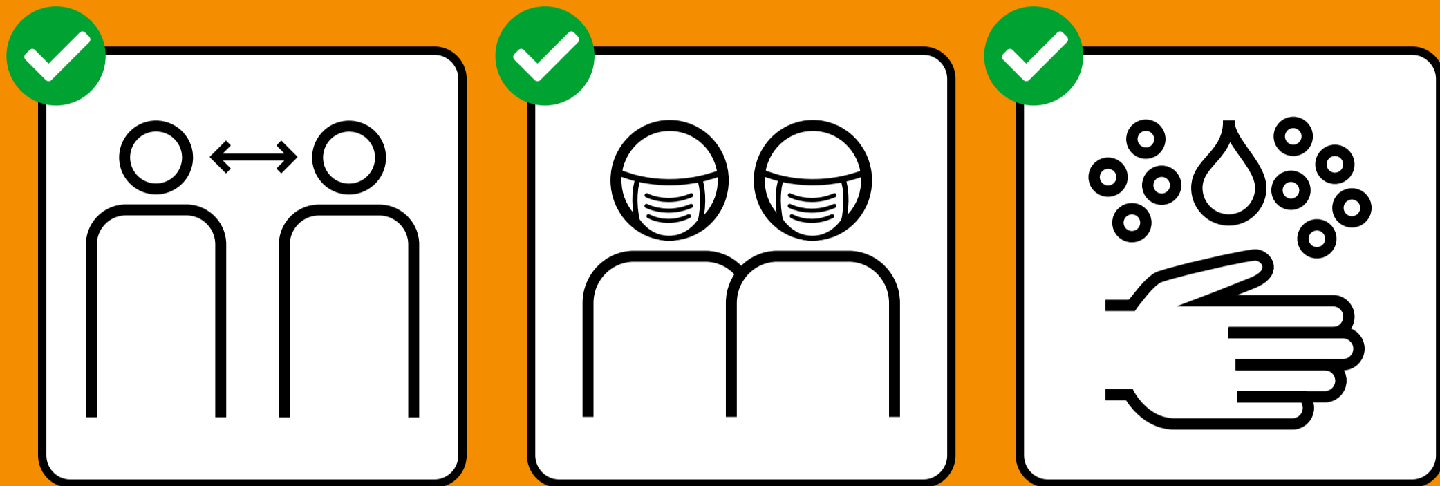
Tenersi a distanza.