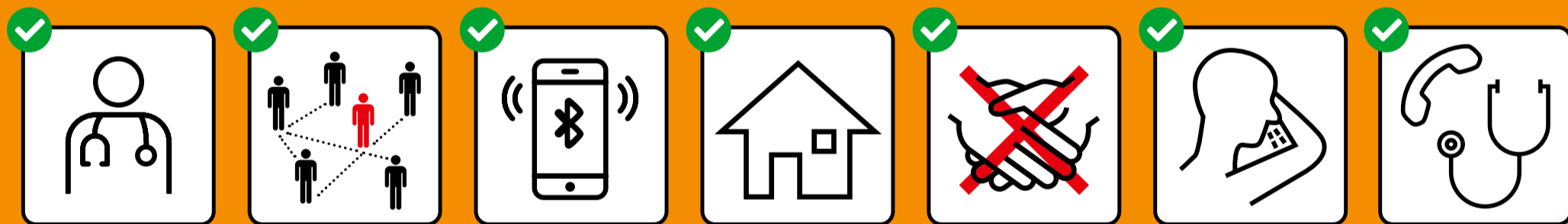
In caso di sintomi, fare immediatamente il test e restare a casa.